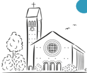
R.K. Parochie O.L. Vrouw van de Berg Karmel Aalsmeer 6 maart 9.30u