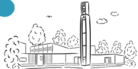
R.K. Parochie Emmaus Uithoorn 10 april 11.00u