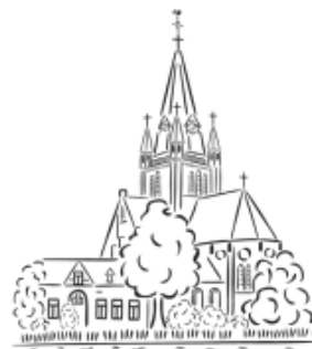
R.K. Parochie St. Urbanus Nes aan de Amstel 3 april 9.30u