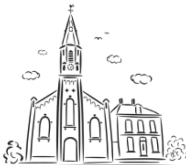
R.K. Parochie St. Jan Geboorte Kudelstaart 13 maart 11.00u