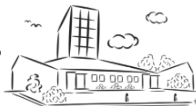
R.K. Parochie St. Jans Geboorte De Kwakel 27 maart 9.30u